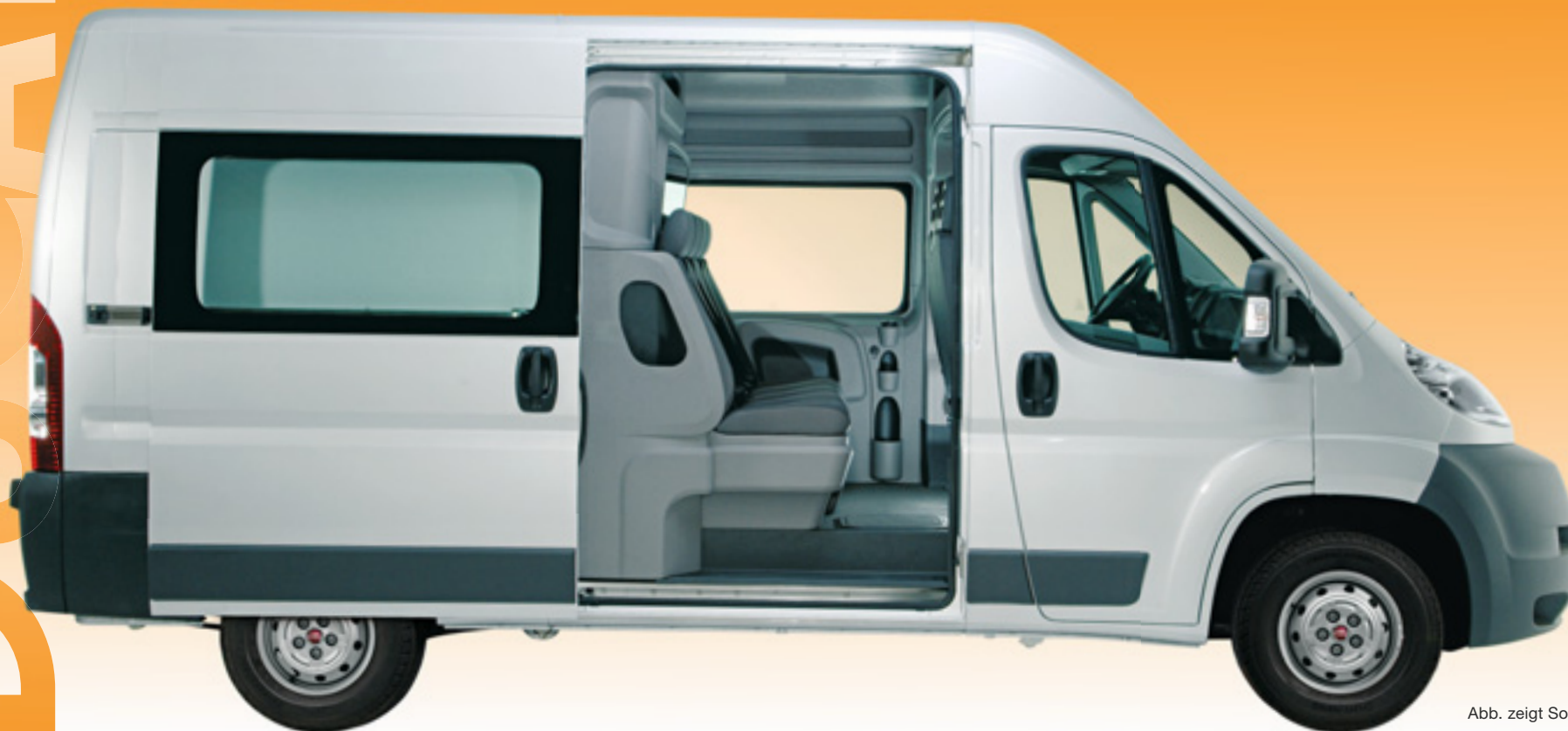
Abb. zeigt Sonderausstattung.