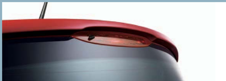
Heckspoiler z. B. für den Renault Modus.a

Ein Heckspoiler fügt sich nahtlos in die Linie Ihres Renault ein und ist eine ideale Ergänzung der Styling-Kits. Für fast alle Renault Modelle erhältlich. ABE beiliegend.