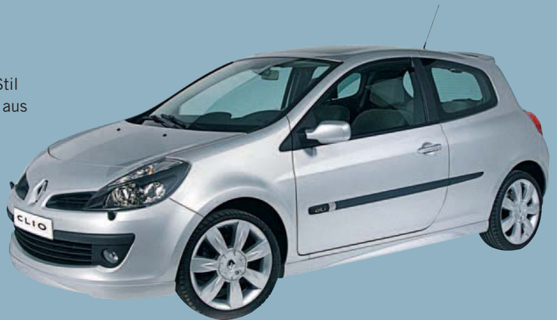
Styling-Kit Sport z. B. für den Renault Clio.

Betonen Sie die Dynamik Ihres Renault und zeigen Sie Ihren Stil mit einem Styling-Kit, passend zu Ihrem Fahrzeug. Bestehend aus Front-, Heckschürze sowie Seitenschwellern. ABE beiliegend.