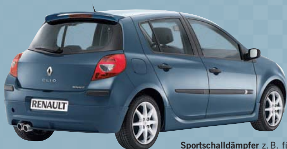
Sportschalldämpfer z. B. für den Renault Clio.

Ein Sportschalldämpfer mit dynamischem Design unterstreicht den sportlichen Stil Ihres Renault. Für fast alle Renault Modelle erhältlich. Kompatibel mit den Styling-Kits von Renault. Verchromte Endrohre.