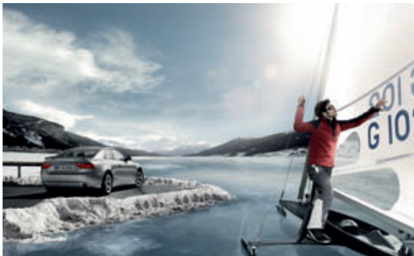
12 ▶ Gute Vorbereitung auf die Wintersaison.