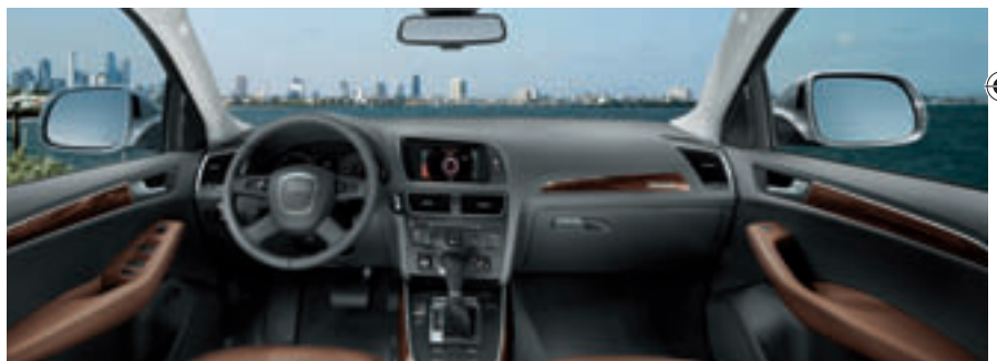
Hochwertige Materialien und beste Verarbeitungsqualität erfüllen im Innenraum selbst höchste Ansprüche.

Im jedem Audi Q5 kommt ein ganzes Bündel an Detaillösungen zum Einsatz, die den Gesamtverbrauch und den CO 2 -Ausstoß um ca. 15 Prozent verringern. So fördert eine neue Flügelzellenpumpe für die Servolenkung stets nur die tatsächlich gerade benötigte Ölmenge. Konsequenter Feinschliff senkt die innere Reibung bei allen Motoren und verbessert damit den Wirkungsgrad der Aggregate. Weiterhin führt ein intelligentes Temperaturmanagement im Kühlkreislauf des Audi Q5 dazu, dass die Motor-Betriebstemperatur früher erreicht wird und das Aggregat deshalb schneller effizient arbeiten kann. Zusätzlich gewinnt der SUV im Schiebetrieb, also in Brems- und Ausrollphasen, Energie zurück. Diese wird in einer Batterie gespeichert und bei Beschleunigungsprozessen wieder eingesetzt.