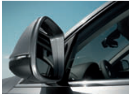
Ein LED-Band im Außenspiegel dient als zusätzlicher Seitenblinker.