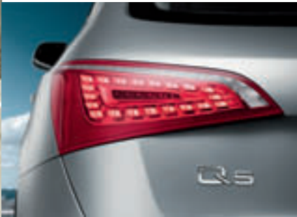
Auch die Heckleuchten des Performance-SUV sind mit aufmerksamkeitsstarker LED-Technik bestellbar.