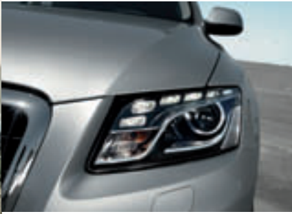
Die markanten Scheinwerfer des Audi Q5 sind ein prägendes Element der Frontpartie.