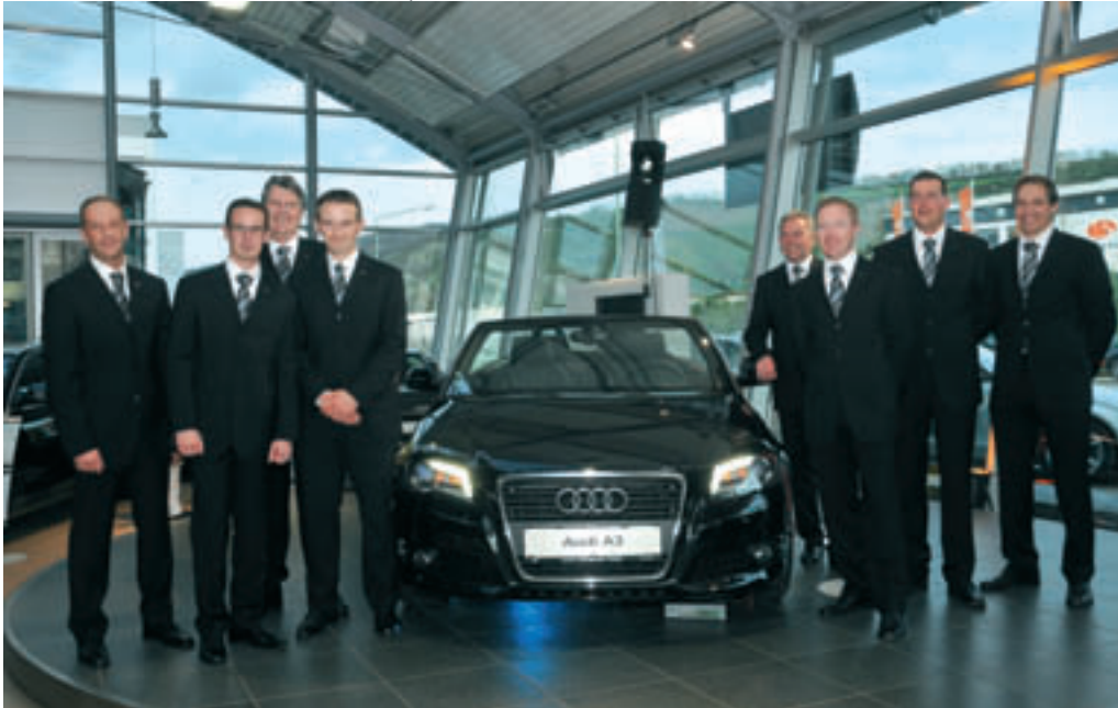
Das Verkaufsteam des Audi Zentrum Trier freute sich, das Audi A3 Cabriolet zu präsentieren.