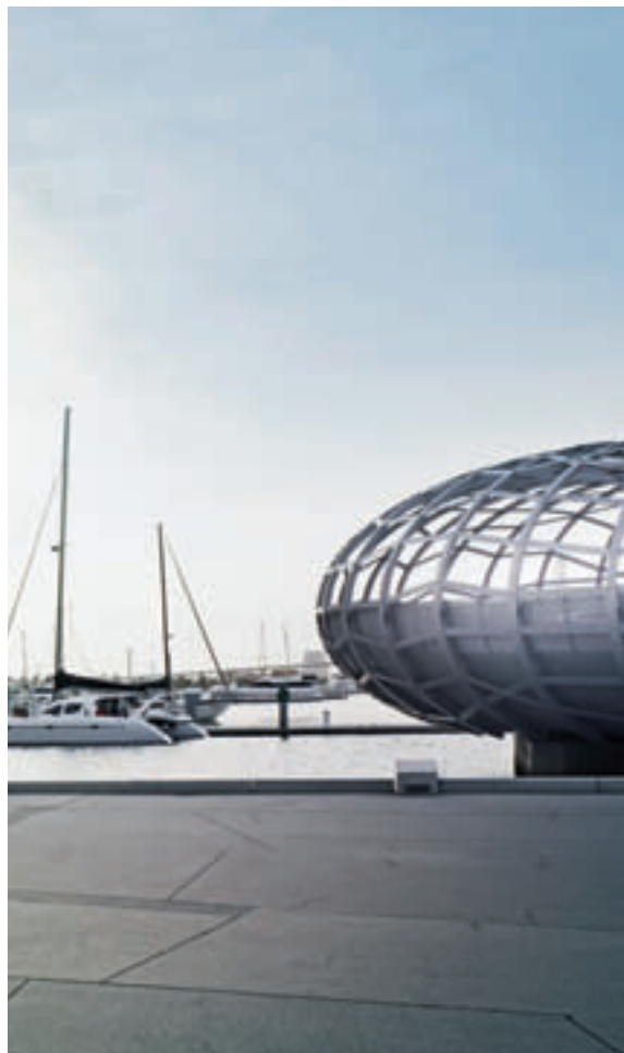
06 ▶ Angekommen: der neue Audi Q5.