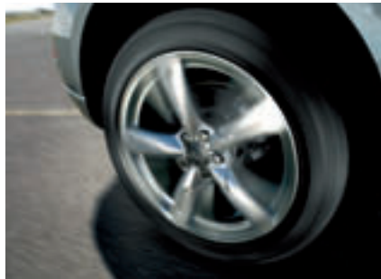
Für den Audi Q5 sind hochwertige Aluminium-Leichtmetallräder in 17, 18, 19 und 20 Zoll verfügbar.