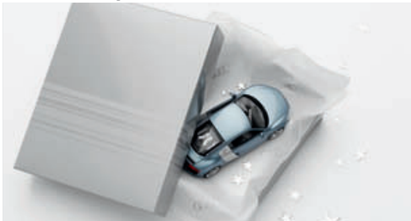
18 ▶ Ideen für den Gabentisch.