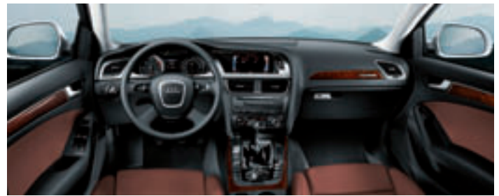
Komfort im Fahrgastraum.

**88 kW (120 PS) bis 176 kW (240 PS); Kraftstoffverbrauch in l/100 km: kombiniert 5,3–7,2; CO 2 -Emission in g/km: kombiniert 140–186