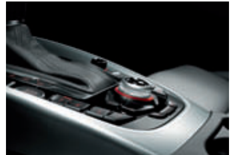
Mit dem Dreh-Drück-Regler in Verbindung mit dem MMI Navigation plus werden Fahrzeug- und Infotainment-Funktionen komfortabel gesteuert.

zwei elektronischen Regelsystemen, die im Audi Q5 unabhängig voneinander angeboten werden: der Stoßdämpfer-Regelung und der Regelung der Lenkung.